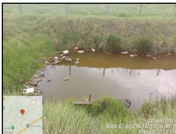
Ilustración 3. Afectación canal Isla Galicia, vereda La Isla. Punto 4.