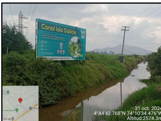
Ilustración 7. Evidencia recorrido, punto 5.