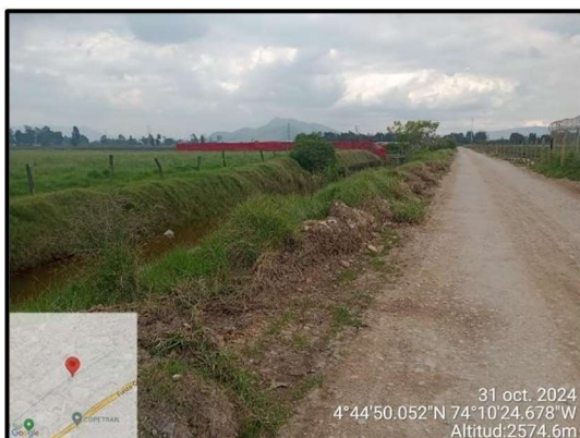
Ilustración 6. Evidencia recorrido, punto 3.