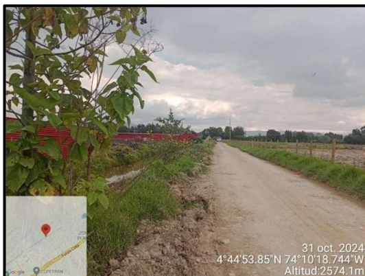
Ilustración 4. Evidencia recorrido, punto 1.

Adicional a ello, en los puntos 1, 2, 3 y 5 no se evidenciaron anomalías que afecten el componente ambiental propio del recorrido de control y vigilancia en la vereda La Isla, como se observa en las siguientes ilustraciones: