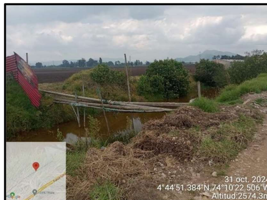
Ilustración 5. Evidencia recorrido, punto 2.